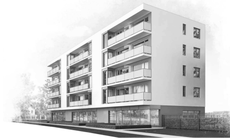
GDYNIA - UL. BOSMAŃSKA

** Rodzaj, wymiary i usytuowanie wyposażenia lokalu stanowią przykładowy model funkcjonalny i nie stanowią projektu architektonicznego aranżacji.